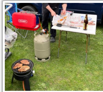
Grillen nach „Camper-Art,,

Abends ging es dann mit dem Programm weiter. Wir sind zusammen beim Griechen im Grünen Baum eingekehrt. Mit Einbruch der Dunkelheit begann dann unsere Nachtwächterführung in Eberbach